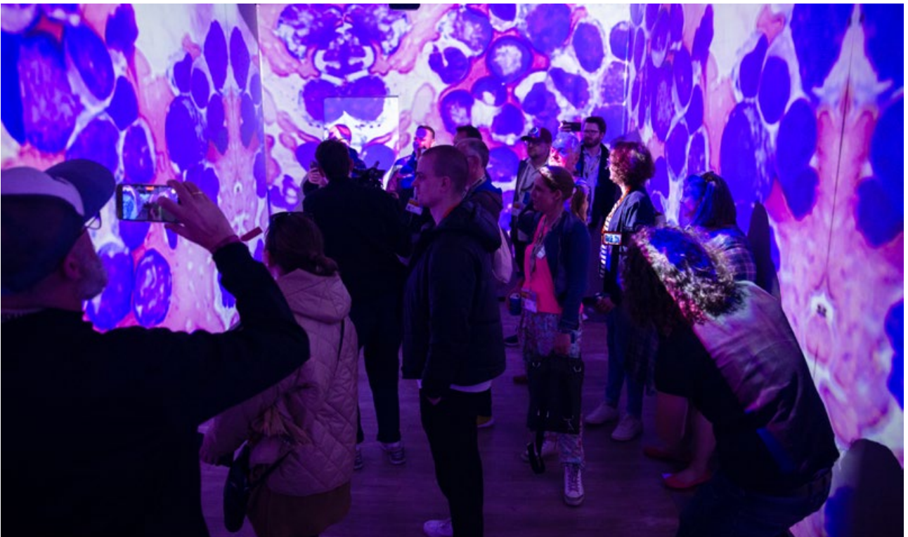
Impressionen von der SXSW