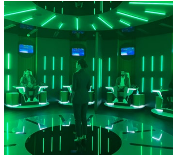
Besuch des SK T.Um Zukunftsmuseum